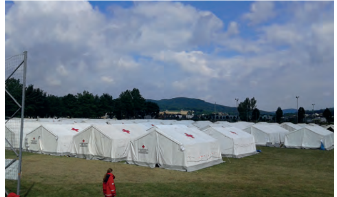
JRK-Bundeslager/Zeltstadt in Leonding ÖO