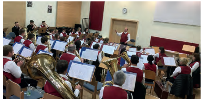
Probe für die Konzertmusikbewertung im Musikheim