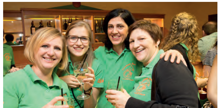
Gemütliche Damen-Runde in der Weinbar