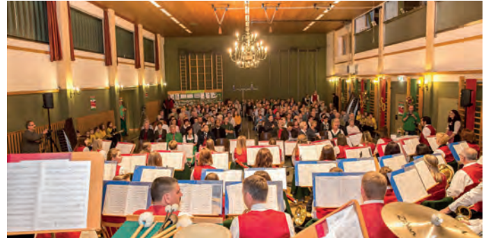
Ein Konzert aus der "Schlagzeuger-Perspektive"