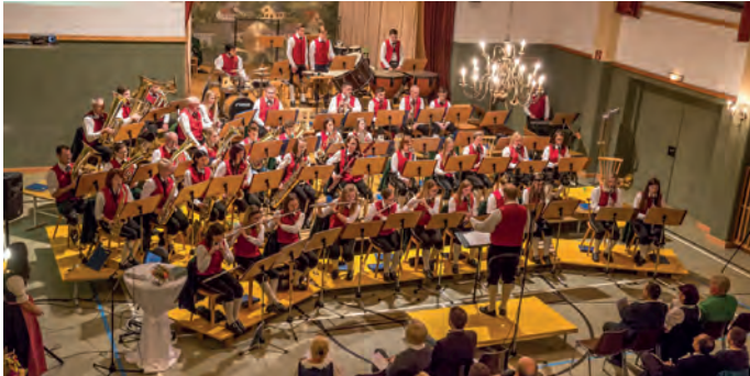
Eröffnungstück des Jubiläumskonzerts