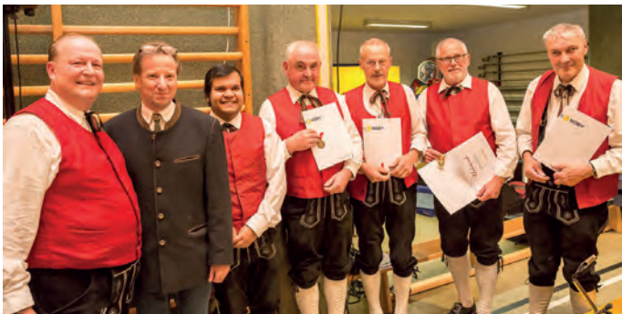
Ehrungen für langjährige Kapellen-Mitglieder