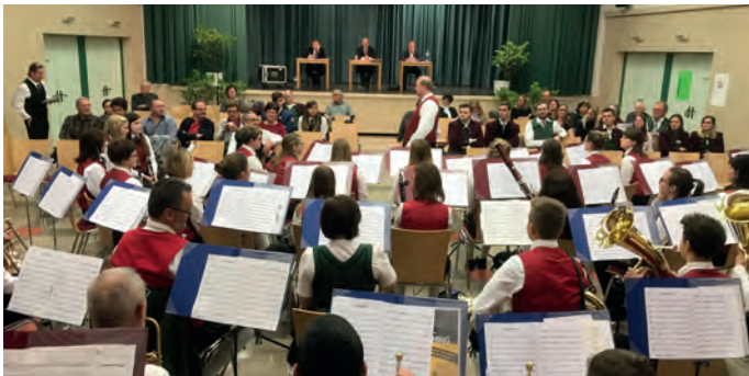
Fertig geprobt: Konzertmusikbewertung in Traisen