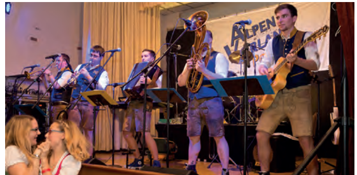
AlpenVorlandPower sorgte für Stimmung am Kathreintanz