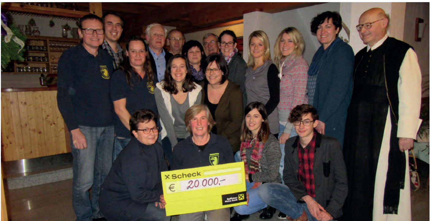
Dank der perfekten Zusammenarbeit aller Beteiligten konnten 20.000 Euro für die Araburg gespendet werden.

In Vorfreude begeben wir uns bereits auf die Suche nach einem neuen unterhaltsamen Stück und blicken zuversichtlich auf ein erfolgreiches Theaterjahr 2019!