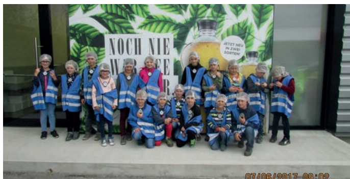
Ausflug zur Vöslauer Abfüllanlage in Vösendorf.