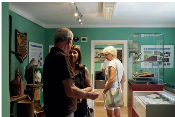
Den Besuchern gefällt die Ausstellung sichtlich gut. Der Museumsdirektor beantwortete offene Fragen.