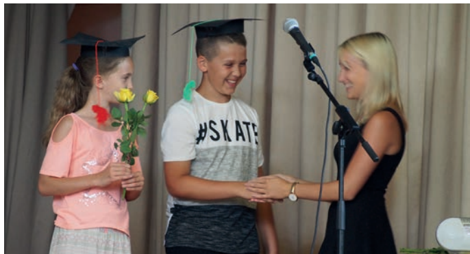
Die Verabschiedung der 4.Schulstufe.