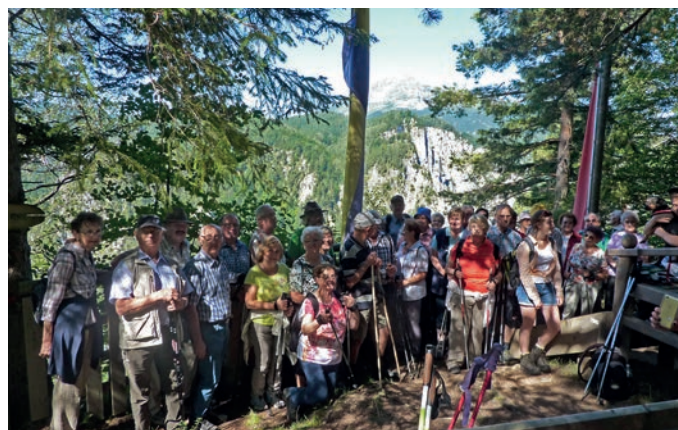
Teilnahme am Bezirkswandertag in Annaberg.

Eine große Gruppe von Senioren nahm am Bezirkswandertag in Annaberg teil. Nach der Zusammenkunft bei der Ötscherbasis Wienerbruck ging es zum Kraftwerk Stierwaschboden und durch die Tormäuer, eine zweite Gruppe besichtigte den Schrägaufzug und den Kaiserthron.