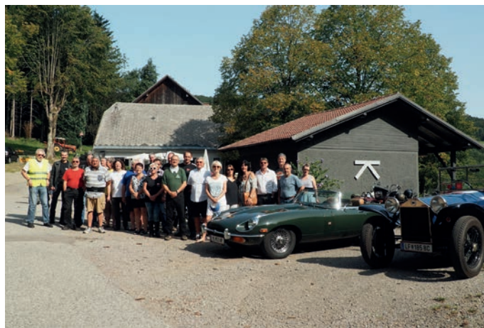
Schöne Autos und wunderbare Stimmung beim Oltimetreffen – Treffpunkt auf der Klammhöhe.