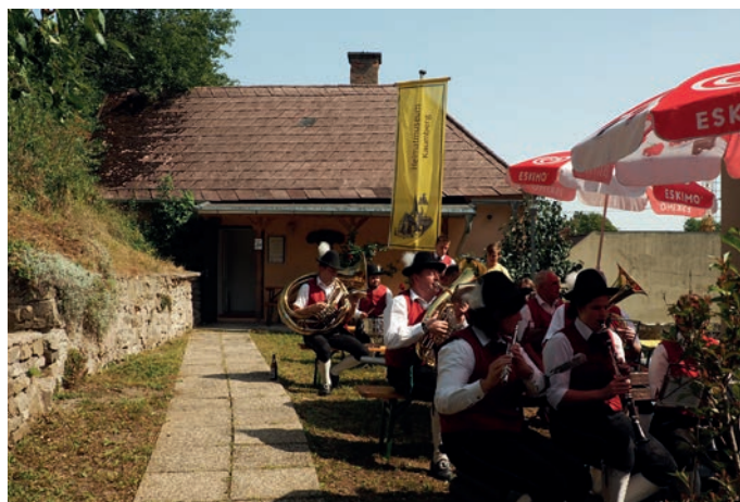
Musikalische Umrahmung der Eröffnung durch unsere Jugend u. Trachtenkapelle Kaumberg