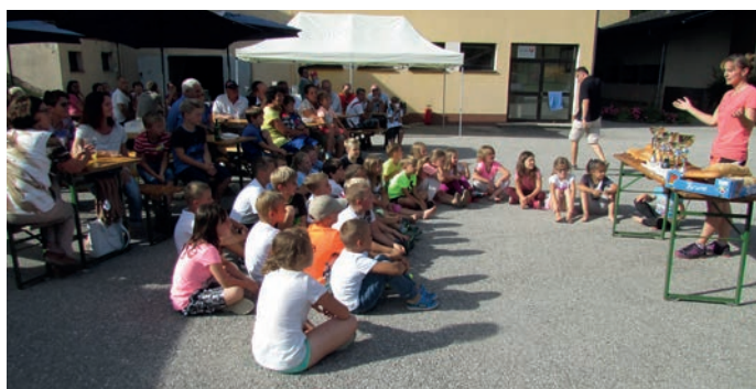
Unser Schulfest war wieder mal einmalig - Danke!