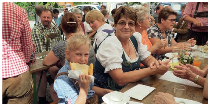
Dem Enkerl der Seniorenbundobfrau schmeckt's.