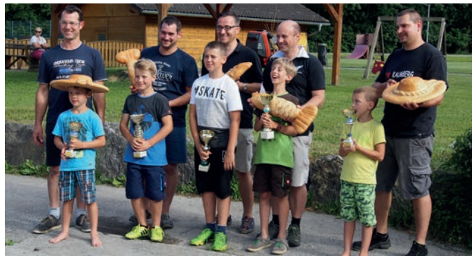
Die Sieger unseres Wettkampfes am Schulfest.