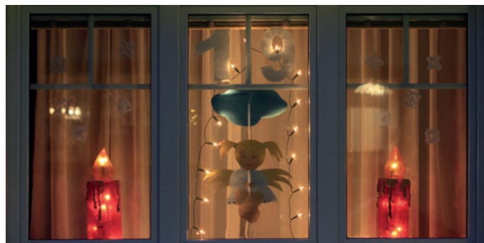
Auch heuer gibt's wieder einen Fensteradventkalender. Außerdem findet am 5. Dezember die Nikolofeier statt!