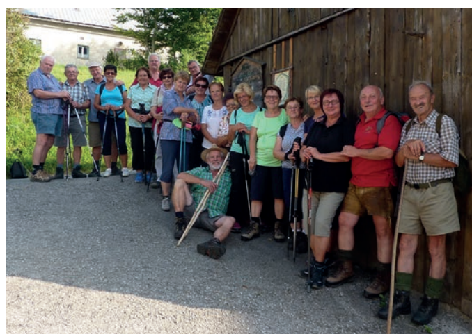
Oben: Ein gemütlicher Nachmittag im Almgasthaus Billensteiner. Links: Unsere Wanderung auf den Peilstein.