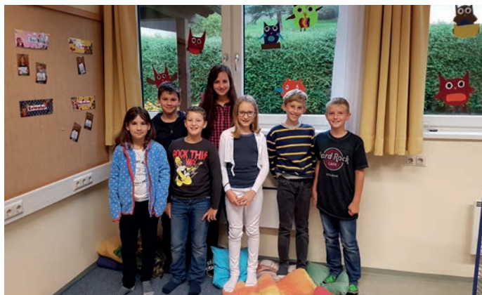
Wir dürfen eine neue Frau Lehrerin bei uns begrüßen.