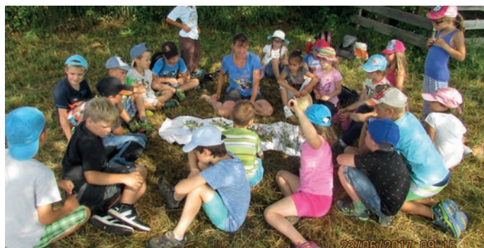
Riesenspaß bei der Wald uns Wiesenführung.