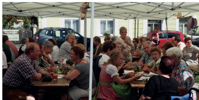
Der Kräuterfrühschoppen war bestens besucht.