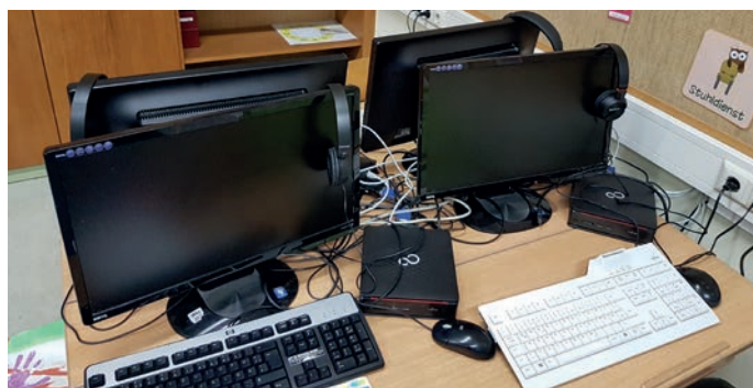
Neue Computer und Bildschirme für den Unterricht.