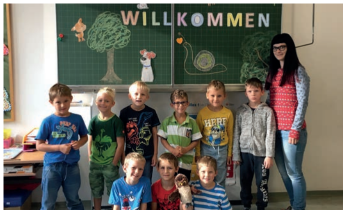
Begrüßung der Taferlklässler in der Waldtierklasse.