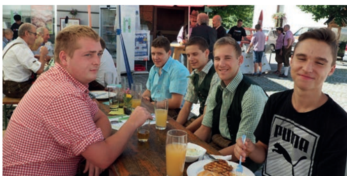
Auch die Jugend war beim Frühschoppen vertreten.