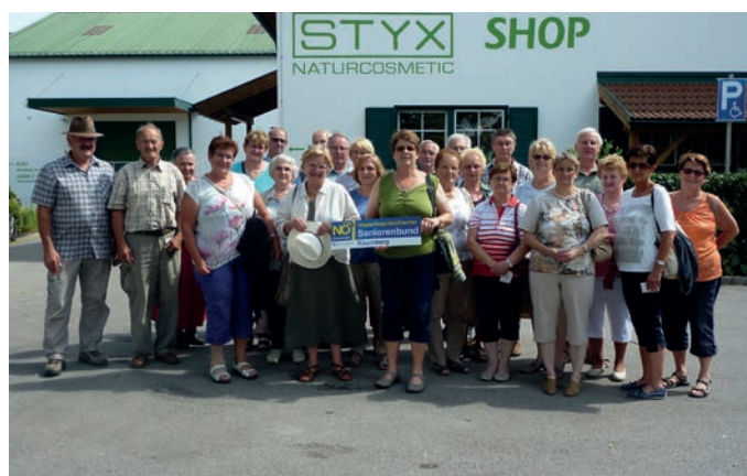
Ausflug zur Firma Stix in Obergrafendorf.

Am 12. Juli fuhren wir nach Obergrafendorf zur Firma Stix-Naturkosmetik. Nach einer interessanten Führung durch das Werk gab es noch eine Verkostung von Schokolade aus der Eigenproduktion. Den Abschluss bildete ein Heurigenbesuch.