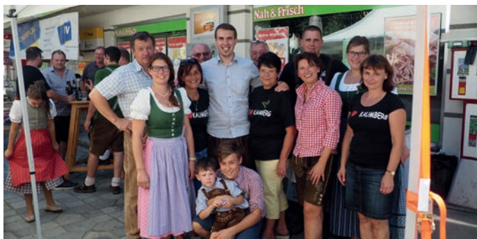
Das fleißige Organisationsteam und einige Helfer des Kräuterfrühschoppen gemeinsam mit dem Bürgermeister.