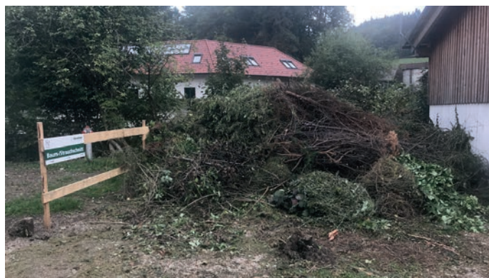
In diesem dafür vorgesehenen Bereich sollen ausschließlich Baum- und Strauchschnitt entsorgt werden!

Bauhof und Straßenbauangelegenheiten freut es mich, dass wir in den zurückliegenden Monaten wieder einige Projekte umsetzen konnten und vorangebracht haben. So haben wir beispielsweise die Optimierungen am Bauhof abschließen können und auch die Landjugend hat ihr neues Sprengelheim, wie angekündigt, in einem Teilbereich des Bauhofes bezogen. Zu diesem mutigen Schritt gratuliere ich den Verantwortlichen und hoffe auf gute Nachbarschaft! In Planung ist derzeit die Ausstattung der Müllcontainer mit Deckeln, um eine Steigerung der Effizienz samt Kostenersparnis zu erreichen. An dieser Stelle möchte ich auch