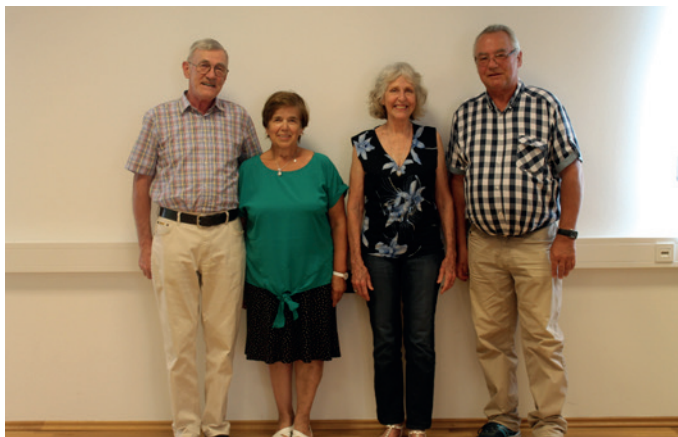
Wir gratulieren herzlich zum 70er.