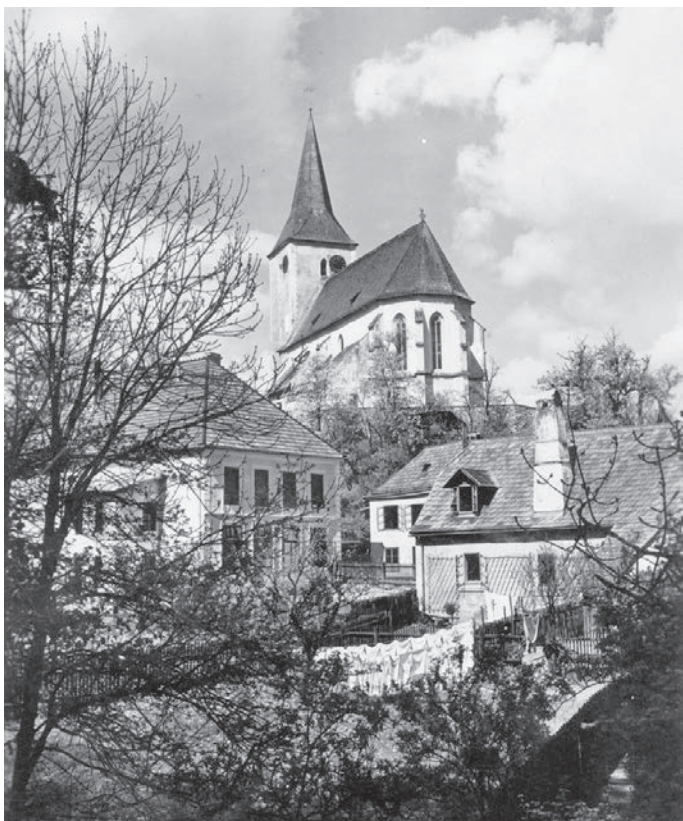
Blick auf die Kirche, die alte Schule, das Heimatmuseum und das ehemalige Forsthaus.