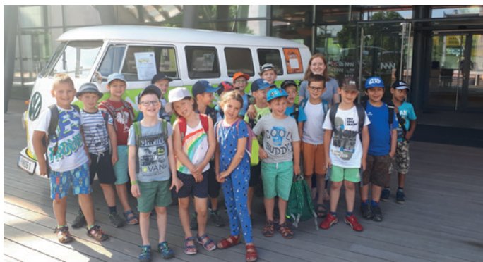
Das Landesmuseum war toll.