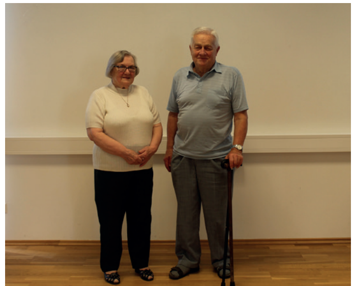
Alles Gute zum 85er.