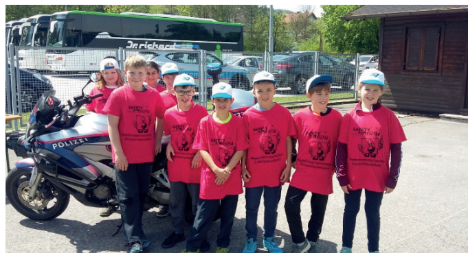
Safety Tour in Hainfeld.