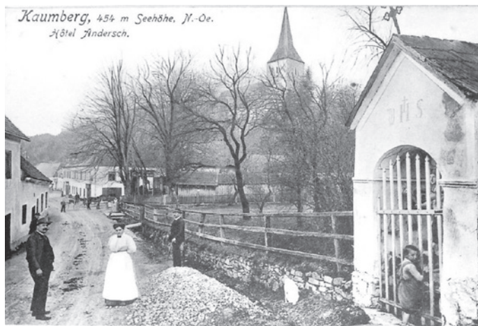
Blick auf die Kaumberger Pfarrkirche von der „Pyrringer-Rath-Kapelle“ um 1910