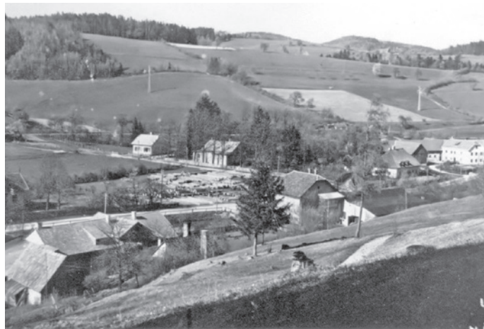
Kaumberg Blick von der Promenade Richtung Bahnsied-