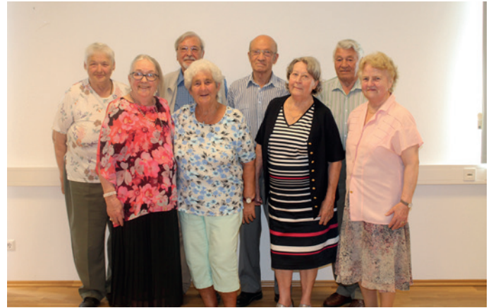
Unsere junggebliebenen 80er.

Zum bereits fünften Mal fand ein geselliger Geburtstags-Gratulationsnachmittag, diesmal im Seminarzentrum Brandtner, statt. Alle runden und halbrunden Geburtstagsjubilare/innen ab ihrem 70er wurden von der Gemeinde zu Kaffee und Kuchen eingeladen. Als kleines Geschenk gab es ein Holzbrett mit eingebranntem Marktwappen und Kaumberger Köstlichkeiten. Es war ein sehr unterhaltsamer und lustiger Nachmittag.