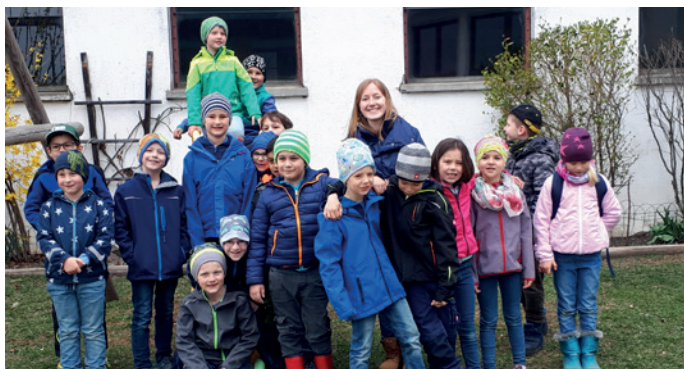
Ein Besuch am Bauernhof ist spannend.