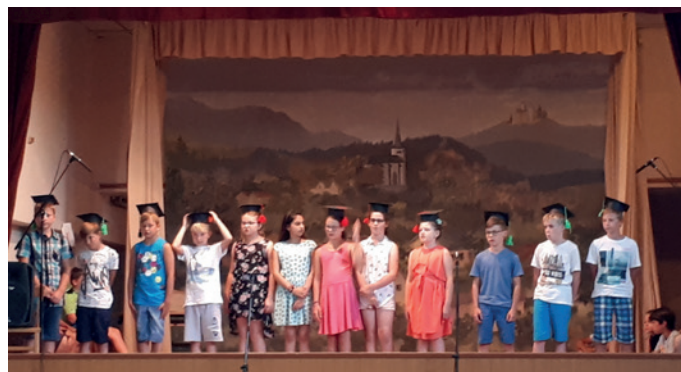
Schulschlussfest der Volksschule Kaumberg.