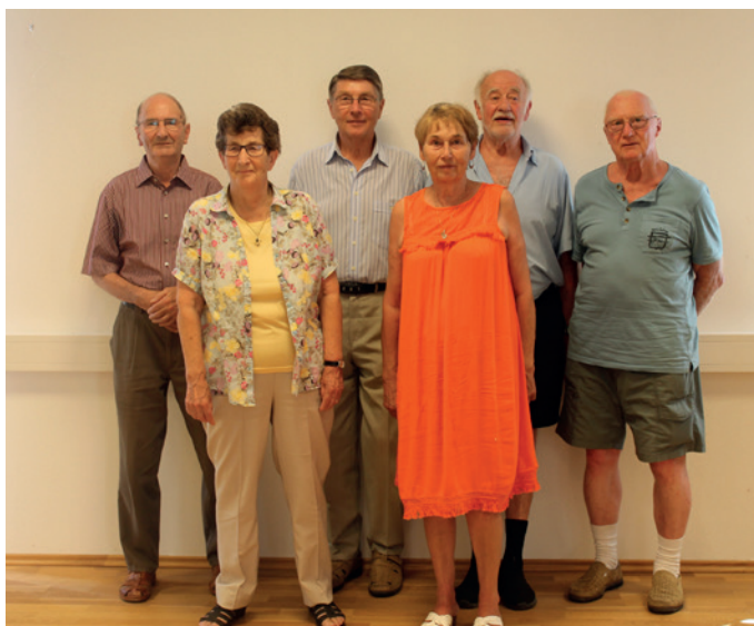
Herzliche Gratulation zum 75er.