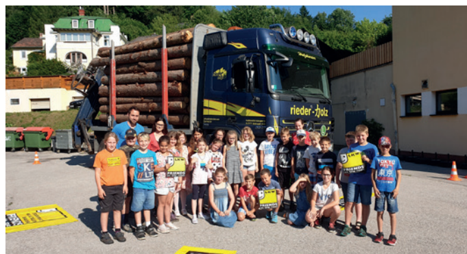
LKW - Friends on the road.