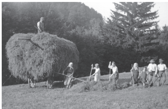
BESITZER: Familie Nagl, URHEBER: Familie Nagl Heuernte um 1943 – Fam. Nagl