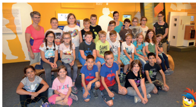
Projekttag im Waldviertel.