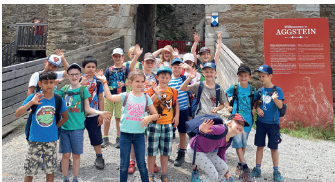
Abenteuerspiel auf der Ruine Aggstein.