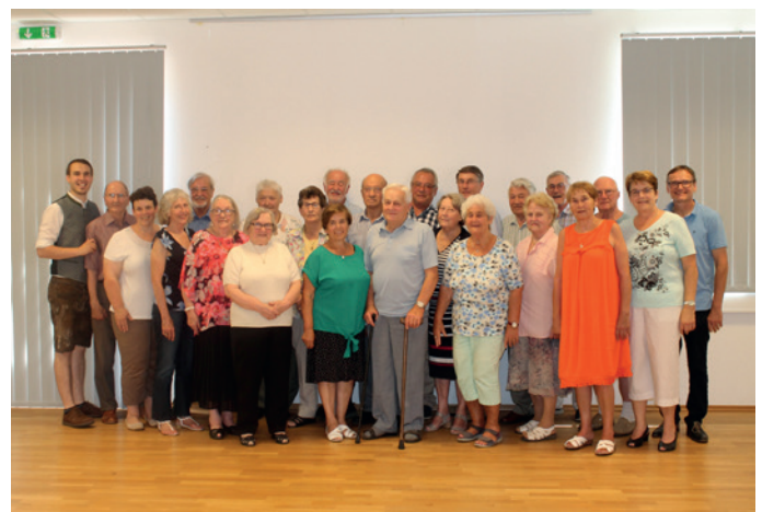
Ein Gruppenfoto aller Jubilare.