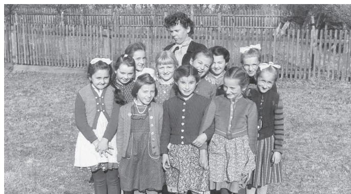
Schulklasse Kaumberg (um 1957). Besitzer: Gemeinde