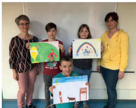
Zeichenwettbewerb der Raiffeisenbank.