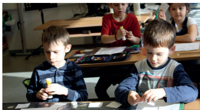
Die Kindergartenkinder besuchten die 1. Schulstufe.