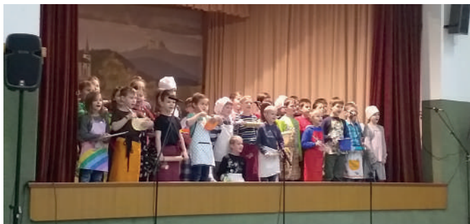
Weihnachtsfeier mit tollen, musikalischen Darbietungen.