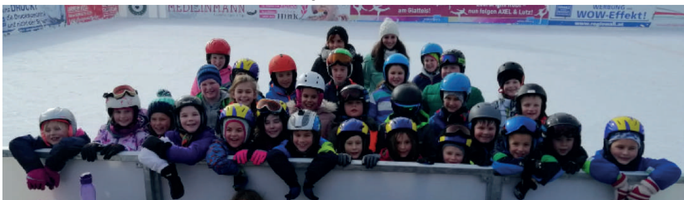
Wir waren auch zusammen eislaufen.