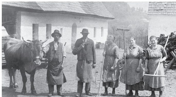
Am Labhof (um 1930). Besitzer: Fam. Apfler