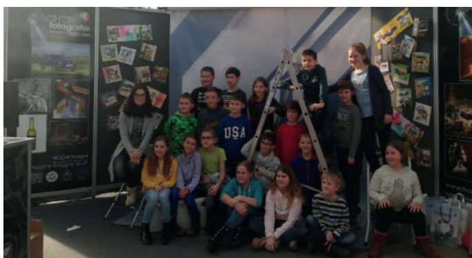
Die Berufsinformationsmesse war sehr informativ.