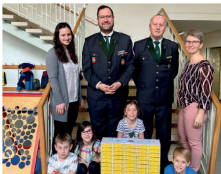
Unterstützung durch den Kameradschaftsbund.