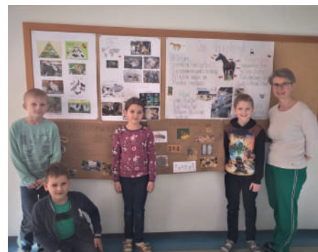
Die 2. Klasse hielt Referate über Tiere.