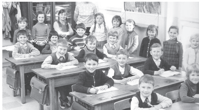
Volksschule Kaumberg (1971/72). Besitzer: Gemeinde